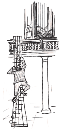
Toonladder D'heim Cartoon van Henk Langenkamp

De laatste restauratie dateert van 2005 door orgelmakerij Gebr. Reil te Heerde, waarbij het orgel grotendeels teruggebracht is in originele staat. Na de heer Borren zijn er vele organisten geweest. Vanaf het begin van deze eeuw is er een organistenteam van 4 organisten gevormd die beurtelings de diensten begeleiden.