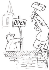
'Openkerk bord' Cartoon van Henk Langenkamp

Een oproep uit het gastenboek: "Doorgaan".