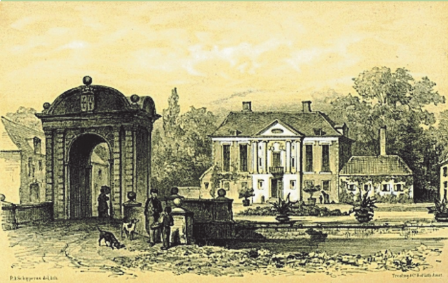
Tekening Huis te Diepenheim anno 1875