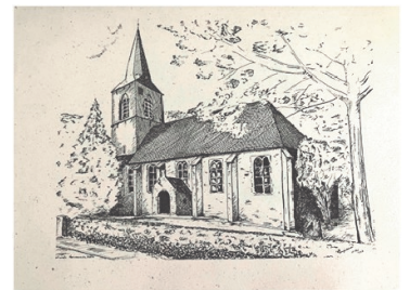
Tekening Henk Langenkamp

Bij deze willen wij iedereen, die medewerking heeft verleend op wat voor manier ook hartelijk bedanken. Hierdoor is het mogelijk dat wij dit jubileum kunnen vieren. We wensen u allen een heel mooi weekend!